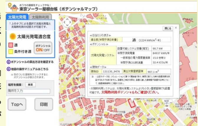
(TOKYO太陽エネルギーポータルサイト)

航空測量データを用いて実際の建物を 3 次元で解析し、建物ごとに予測される日射量、屋根の傾斜や近隣の建物等の影の影響を考慮し、設置可能システム容量や予測発電量等を表示するそうです。同様のシステムが全国に普及し、太陽光発電導入が進むといいですね。