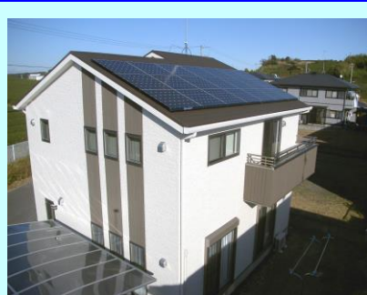
菊川市 S発電所 3.99kW

毎月地球環境に貢献されている皆様をご紹介しますこのコーナー。今号も6発電所をご紹介します。弊社HP等でもご紹介させていただいております。