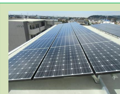
掛川市(産業用) U発電所 12.54kW