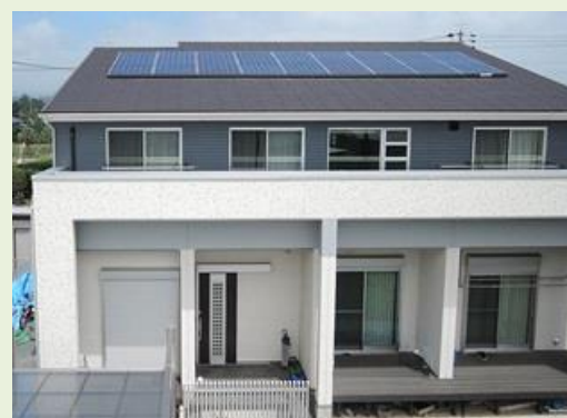
上: 浜松市浜北区S様邸 4.45kWシステム 下: 太陽光発電モニタを手にS様ご家族

今回はご自宅に太陽光発電を設置された浜松市浜北区のS様宅を訪問し、お話を伺いました。