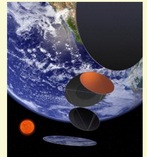
(宇宙航空研究開発機構 JAXA)

日本の企業と研究者による組織で研究が進んでおり、国のエネルギー基本計画でも重点課題に取り上げています。この技術により将来は、家電のコードレス化、電気自動車の無線充電、原発内で稼働する災害用ロボットなどへの活用が期待されます。