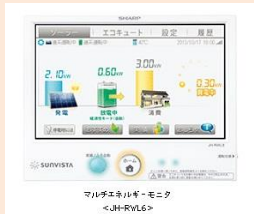
マルチエネルギーモニタ <JH-RWL6>

太陽光発電導入後に蓄電池やエコキュートを追加で設置する場合も1台でコントロール可能です。またスマートハウスに必須の太陽光発電、蓄電池、省エネ機器（エコキュート等）のエネルギー管理をスッキリ1台で行う事ができます。