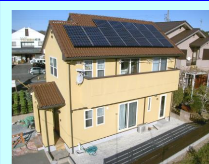
袋井市 A発電所 3.23kW