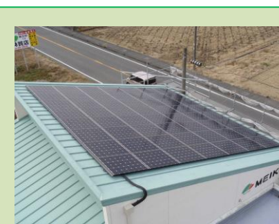
菊川市(産業用) M発電所 10.64kW