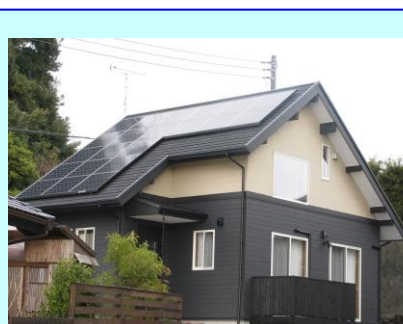
伊東市 I発電所 4.09kW