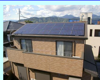
静岡市葵区 S発電所 3.57kW