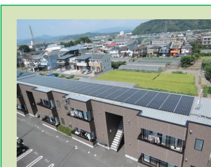
静岡市清水区 (産業用) C 発電所 28.75kW