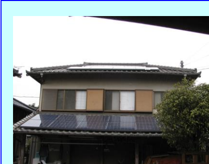
沼津市 N 発電所 3.61kW