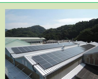
焼津市 (産業用) S 発電所 49.98kW