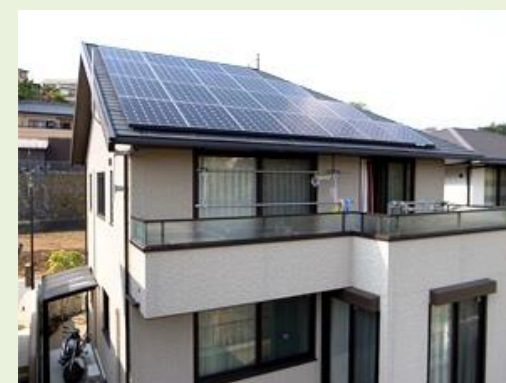
上：三島市 N 様邸 4.06kW システム 下：とても仲の良い N 様ご家族

●太陽光発電がこれからもお子さんの成長の助けになってくれるといいですね。本日はありがとうございました。