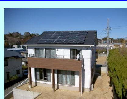
浜松市中区 W 発電所 4.00kW

毎月地球環境に貢献されているらっしゃる皆様をご紹介しますこのコーナー。今号も 6 発電所をご紹介します。弊社 HP 等でもご紹介させていただいております。