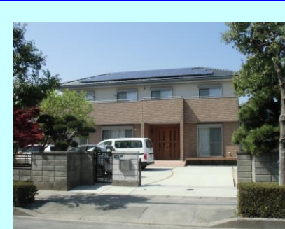
掛川市 T 発電所 3.91kW