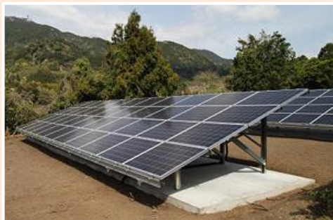
静岡市清水区/野立 25.74kW

全量買取制度が2012年7月に始まって2年以上経ち、発電した電気を全て売電できる10kW以上のソーラーシステムが続々と発電を開始しています。今号では既に稼働開始した当社施工物件を写真でご紹介いたします。