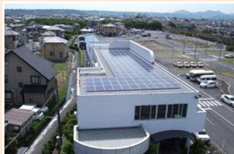
島田市/自動車学校 39.78kW