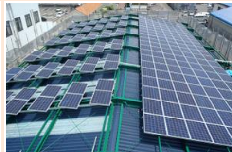
静岡市駿河区/スポーツ施設 42.70kW